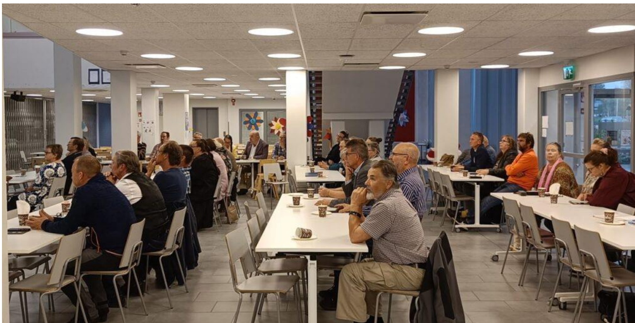
Ilmastohankkeen päätösseminaariin Monitoimikeskus Sillan saliin oli ahtautunut runsaasti väkeä.

meenkyrön kunnan puheenvuoro). Tilaisuudessa palkittiin myös Pirkanmaan Vuoden Kylä, Kylätöimija ja Kyläteko 2024. Kyläparlamenttiin osallistui paikan päällä reilut 50 henkilöä.