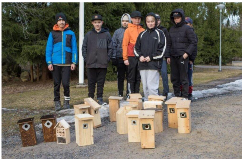
Tottijärven nuorten tempaus luonnon ja lintujen puolesta.

Vuoden kylätoimintatunnustukset jaettiin Hämeenkyrössä Kyläparlamentti-tapahtuman yhteydessä 25.9. Tilaisuudessa oli paikalla reilut 50 henkilöä.